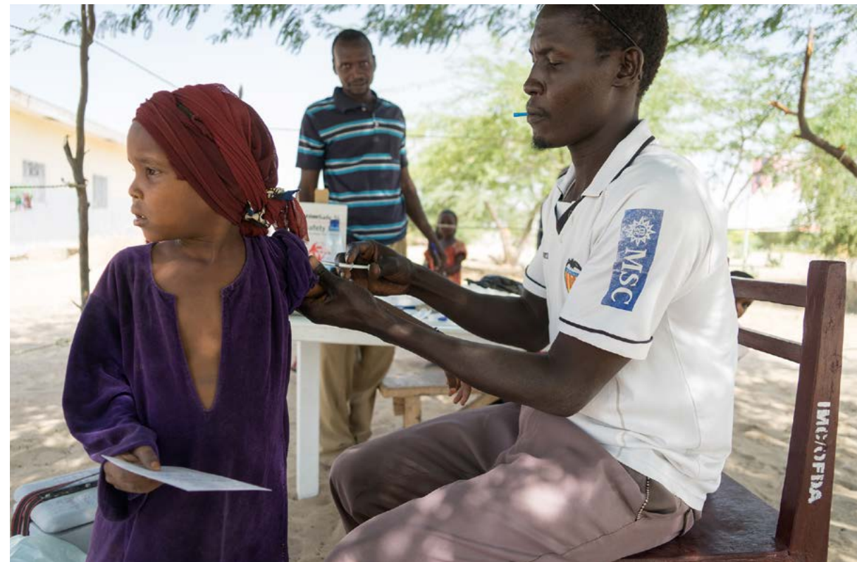
Novembre 2016, Tchad. Cette fillette est vaccinée contre la rougeole pour éviter une recrudescence de cette maladie mortelle dans la région.

Grâce à votre générosité, l'UNICEF soutient des programmes de vaccination dans une centaine de pays. Outre l'achat de vaccins, l'organisation forme les agents sanitaires sur place et assure une logistique d'approvisionnement pour ne pas rompre la chaîne du froid, indispensable à l'efficacité du vaccin. Chaque année, plus de 100 millions d'enfants sont ainsi vaccinés dans le monde. Depuis 1988, l'UNICEF est également engagé dans l'Initiative globale pour l'éradication de la polio, l'une des principales causes de handicap chez l'enfant. Aujourd'hui, l'objectif est quasiment atteint car 99 % des cas de polio ont été éradiqués. La disparition totale de la polio est la première étape majeure du Plan d'action mondial pour les vaccins 2011-2020, lancé par l'UNICEF et ses partenaires, et signé par les autorités sanitaires de 194 pays. Son objectif est ambitieux : rendre, d'ici à la fin de la décennie, l'accès à la vaccination universel. Pour que chaque enfant de la planète puisse avoir les mêmes chances de vivre en bonne santé et de s'épanouir.