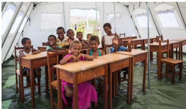
Février 2016, îles Fidji. L'école de ces enfants a été détruite par le cyclone Winston. L'UNICEF a fourni 2 tentes écoles et du matériel.